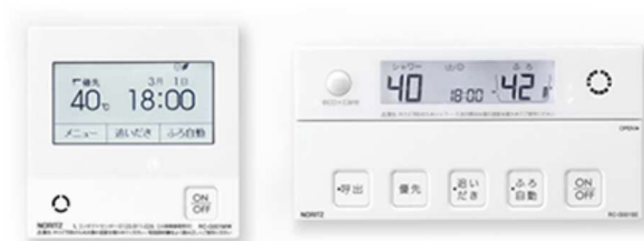
台所用 浴室用 給湯器リモコン RC-G001EW