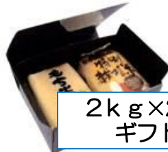
2kg x 2本 ギフト