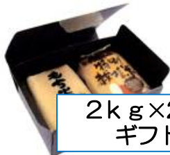
2kg x 2本 ギフト