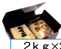
2kg x 2本 ギフト