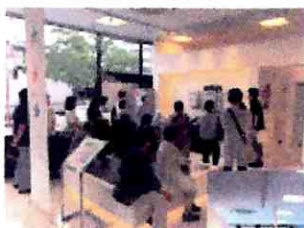
ショールームでは熱心に話を聞いてくださいました。