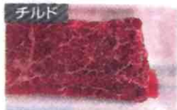
*2013年度品 MR-JX61X (牛ももステーキ肉3日後)

冷凍した食材も朝、氷点下ストッカーDに入れておけば、夕方にはドリップを抑えておいしく解凍できますよ。