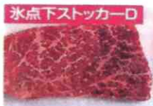
新商品 MR-WX70C (牛ももステーキ肉3日後)