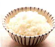
ご飯は研ぎ水から おいしいお水で。