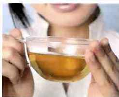
お気に入りの お茶がさらにおいしい。