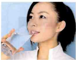
安心でおいしいお水が 毎日飲める。