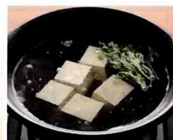
煮物・茹でもの鍋物にも たっぷり。