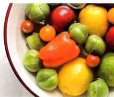
浄水で野菜を洗えば ビタミンが壊れません。