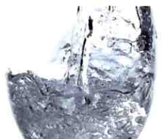
本体取付、 カートリッジ交換も無料です。

高機能 浄水器 AQUA CENTURY アクアセンチュリーステンレス STAINLESS